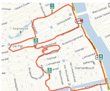
Man met pet, ruim 4 km lopen

grachtengordel kwam een groot konijn. Inmiddels is het aantal schilderende lopers flink toegenomen en werd eind februari de website figurerunning.com met bijbehorend blog gelanceerd. Die bevat naast tips onder meer een Hall of Fame met de mooiste figuren. Op stapel staan evenementen rond speciale thema's, zoals Koninginnedag, en er wordt gewerkt aan een app met gumfunctie. Gezien de mogelijkheden van photoshop lijkt het een kwestie van tijd tot het eerste valse figure in de Hall of Fame hangt. Overigens is dit sportieve tekenen met gps-techniek en smartphone ook mogelijk tijdens fietsen, wandelen of roeien. Vooral op water zijn de tekenmogelijkheden door het ontbreken van obsta-