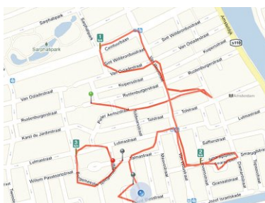
Voetballer met bal, in Amsterdam