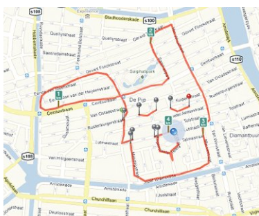
Konijn, Sarphatipark tussen oren